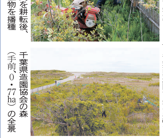
樹高などの生育調査