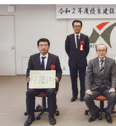
令和2年度優良建設工事表彰式