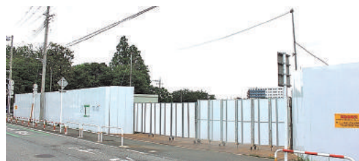
日本大学実習キャンパス向かいの建設地

古ヶ崎浄水場は1940年の稼働開始。老朽化に伴い、2007年10月にほぼ野菊の里浄水場に機能を移して廃止された。