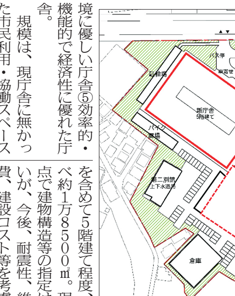
新庁舎整備配置計画図

八千代市は3日、新庁舎等建設基本設計業務委託の公募型プロポーザル選定結果を公表した。提案者は2名、契約候補者に特定されたのは梓設計(東京都品川区東品川2-1-11)。