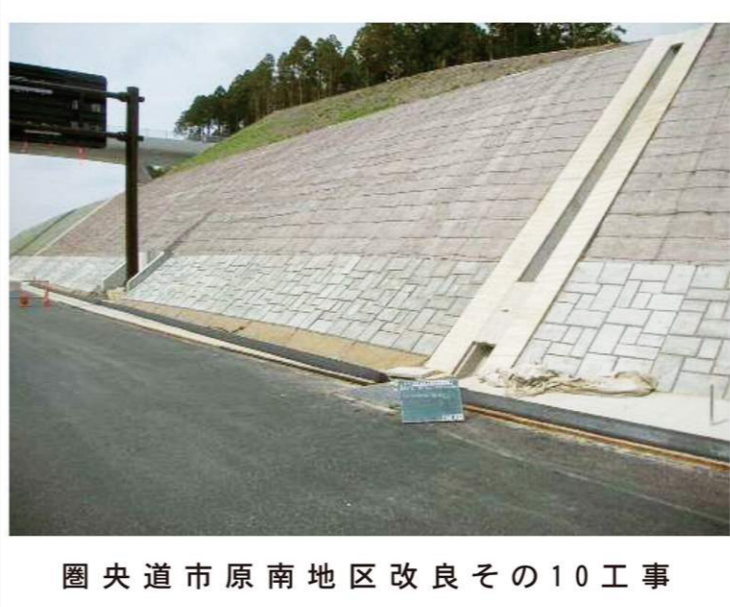
圏央道市原南地区改良その10工事