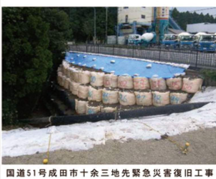
国道51号成田市十余三地先緊急災害復旧工事