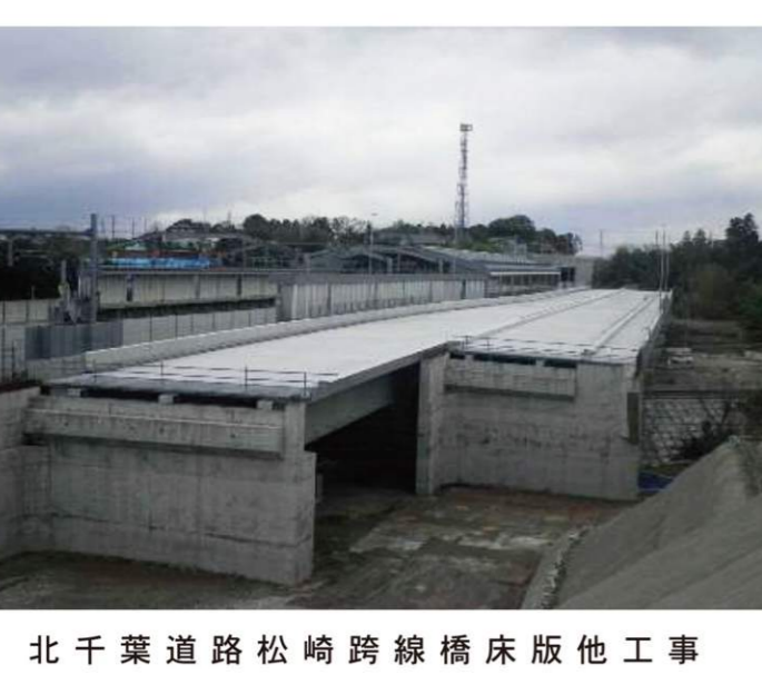
北千葉道路松崎跨線橋床版他工事