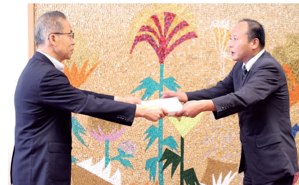
表彰状授与 木村建設工業

加え、工夫を凝らしていたいただきたい」と述べ、あいさつした。 今回の受賞工事の中で、木村建設工業(株)が施工した「船橋市立旭中学校給食棟増築工事」は、学校を運営しながらの工事であり、生徒や近隣住民等の安全はもとより、騒音や振動などにも細心の注意を払う必要があった。 また、学校運営に支障をきたさないように、施工前の入念な調査及び発注者、施工管理者との日々の調整、綿密な