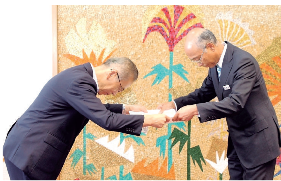
表彰状授与 京成建設

打ち合わせを行い、施工方法等の問題点の有無の確認をして工事を行った。 施工にあたっては、杭打設に先立ち、自主的に地中障害物(コンクリート塊)の試験を実施するなど、工程に大きな支障をきたす事項への対策を講じた。また、学校側からの要望に対しても、その都度誠意をもって対応し、良好な関係を築いた。店社パトロールをはじめ、災害防止協議会、安全教育などの活動に積極的に取り組んだことが評価