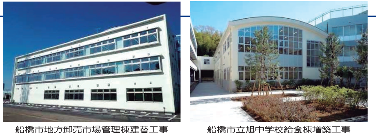
船橋市地方卸売市場管理棟建替工事 船橋市立旭中学校給食棟増築工事