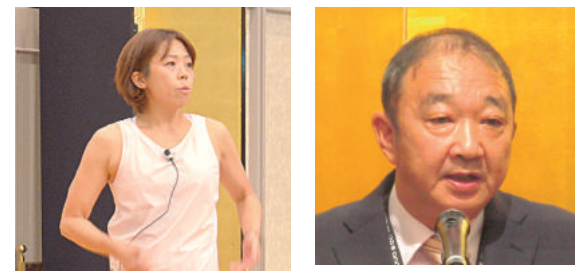
鮫島・千葉市消防局救急課長が祝辞

せっかくの機会をいただきましたので、私から千葉県内の治安情勢について、お話ししたいと思います。まず、治安情勢の目安となる千葉県内の刑法犯認知件数ですが、暫定値ではありますが、本年10月末現在で2万8