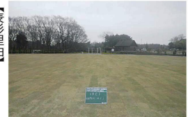
完成した芝生広場

施工過程において適宜、良好な出来映えを確保するための提案を積極的に行った。また、市担当者との綿密な連絡を取り判断を仰ぐなど、効果的な工事を進めた。各種安全活動を適切に実施。記録も整理されており、下請業者全体を適切に監理していたことがわかる。工事目的物の出来栄は良好で、竣工書類も良く整理されていた。