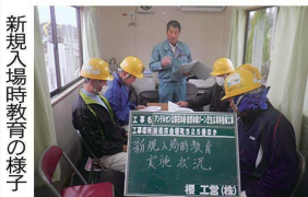
新規入場時教育の様子